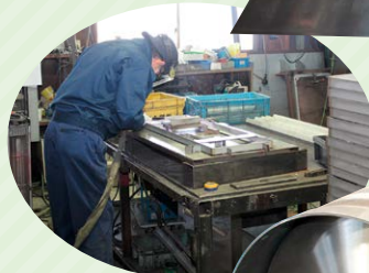
▲溶接加工 (ステンレス)