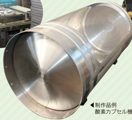
◀制作品例 酸素カプセル機器